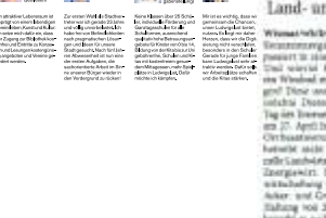
Dietmar Hocke empfängt Sie am Tag der Erneuerbaren Energien am 27. April...