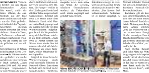
Die Wärme der Erde spüren. Ein Kind hat die Wärme der Erde gespürt.