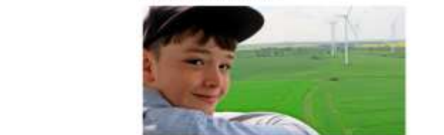
Am Sonntag GRÜNE. Ein Kind hat die Wärme der Erde gespürt.