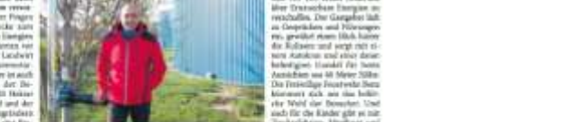
Am Sonntag GRÜNE. Ein Kind hat die Wärme der Erde gespürt.