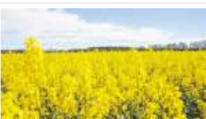
Die gelbe Jahreszeit hat wieder begonnen. Rapeseed ist ein beliebtes Anbaufrucht...