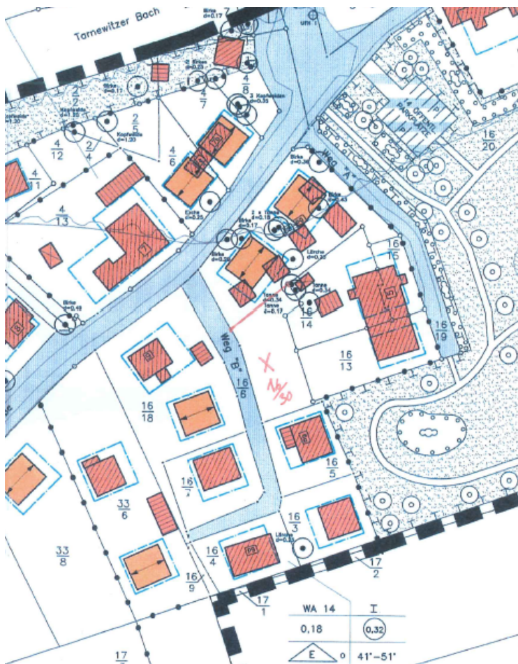
Auszug B-Plan Nr. 17 Teil Tarnewitz Dorf

Bei Zustimmung der begehrten Bauleitplanänderung bedarf es des Abschlusses eines städtebaulichen Vertrages. Darin wird u. a. die Kostenübernahme aller anfallenden Kosten durch den Antragsteller geregelt. Ein Planungsbüro ist festzulegen bzw. zu empfehlen.