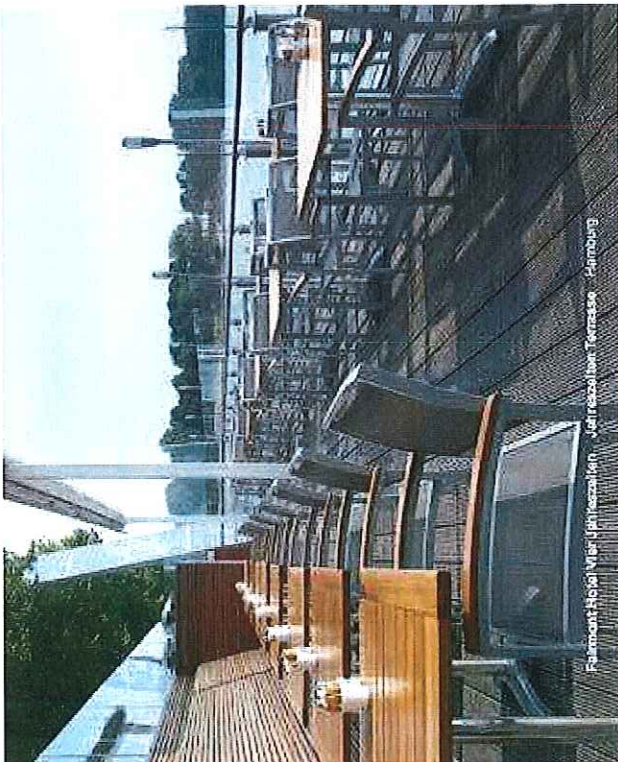
Fairmont Hotel Vier Jahreszeiten - Hamburg