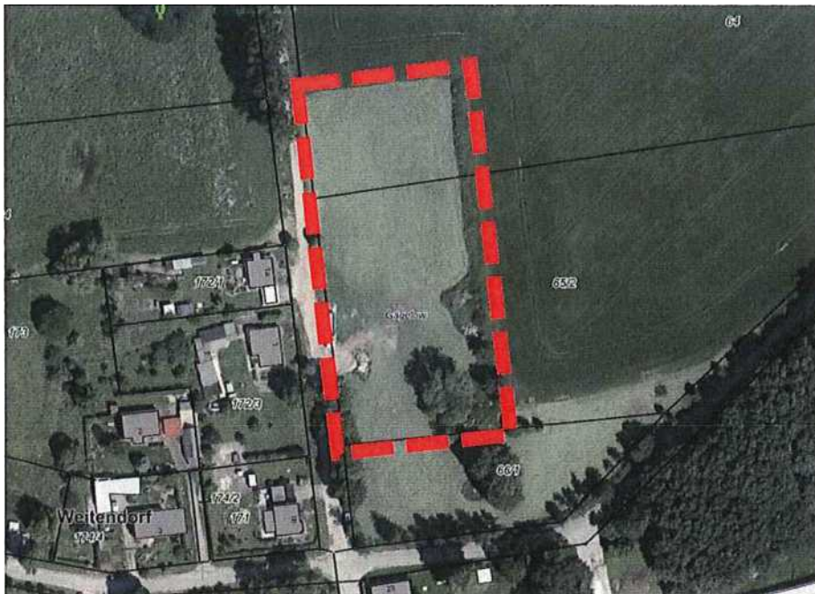
Geltungsbereich 1, Nordosten der Ortslage Weitendorf

Der Geltungsbereich 1 umfasst Teilbereiche der Flurstücke 64 und 65/2 der Flur 1 der Gemarkung Weitendorf und liegt direkt an der Langen Straße Nord nach Neu Weitendorf. Im Norden und Osten grenzt der Bereich an Ackerflächen. Im Westen befindet sich Wohnbebauung und im Süden wurde bereits ein Einfamilienhaus auf dem angrenzenden Flurstück errichtet.