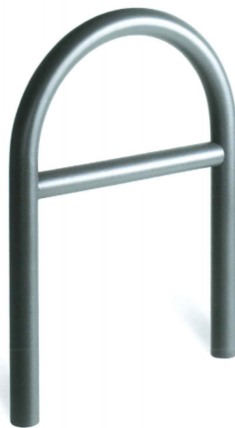
Bügel ca. 800 mm hoch