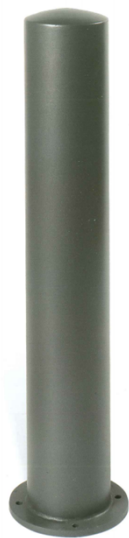
Ca. 1 m hoch/ Durchmesser ca. 17 cm

Sachverhalt: Die Gemeinde möchte noch einiges Stadtmobiliar vor der nächsten Saison anschaffen und aufstellen. Dazu hat die Gemeindevertretung Zierow (GV Beschluß Ziero/16/10715) bereits eine Auswahl getroffen. Es müssten nun Anzahl und Standorte ausgewählt werden. In der Maßnahme Gehweg zum Strand ist bereits Mobiliar vorgesehen.