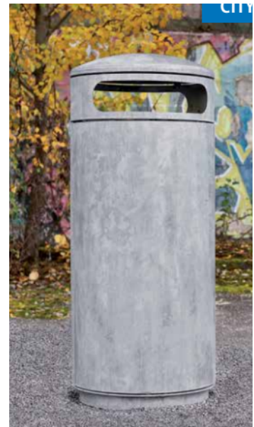
Abfallbehälter 60 bis 80 ltr.