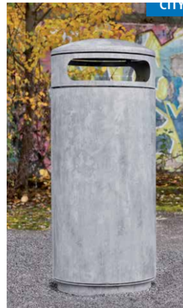
Abfallbehälter 60 bis 80 ltr.