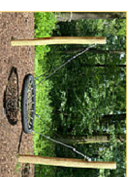
7. Schwingpark - Schwingerschaukel