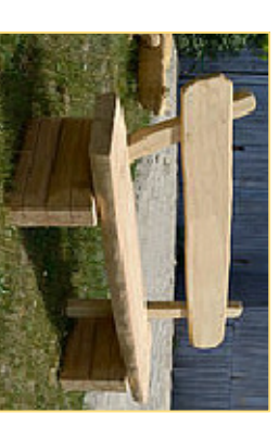
8. Wildbank mit Lehne