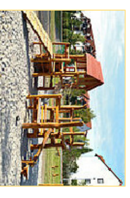
4. Spielkombi "Dorfplatz"