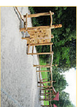
5. Spielkombi "Abenteurowald"