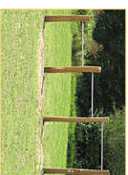
3. Reck - 3 stufig