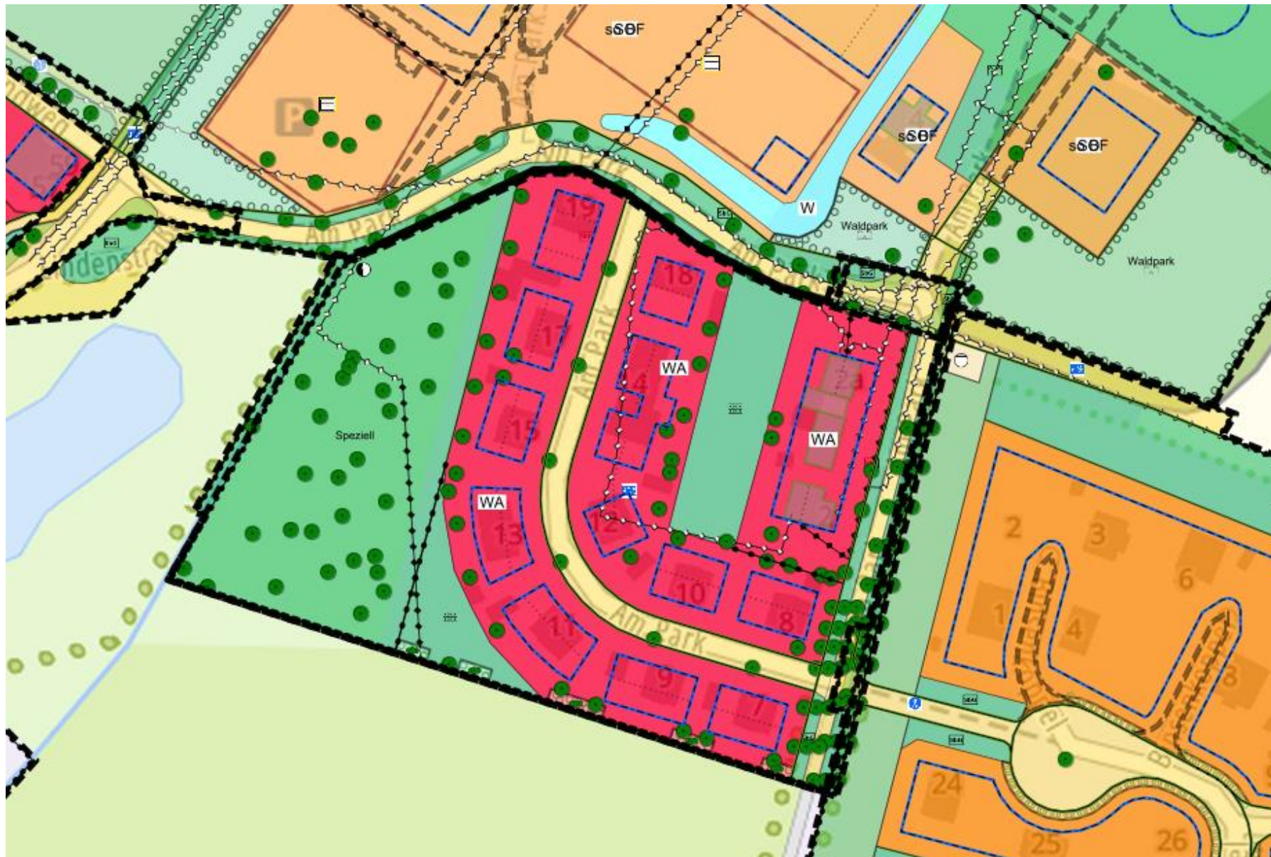
B-Plan Nr. 3.2 „Am Park“ in Groß Schwansee