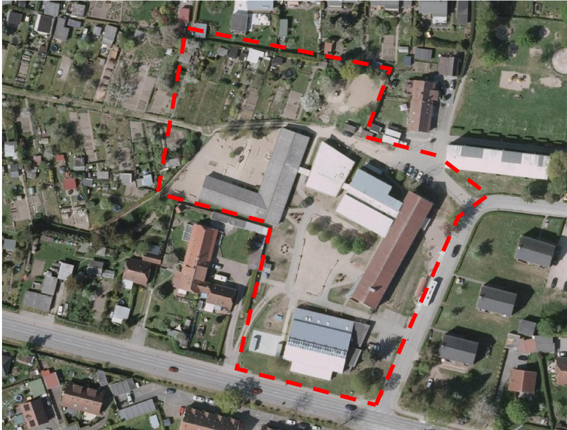
Luftbild des Plangebietes in Proseken