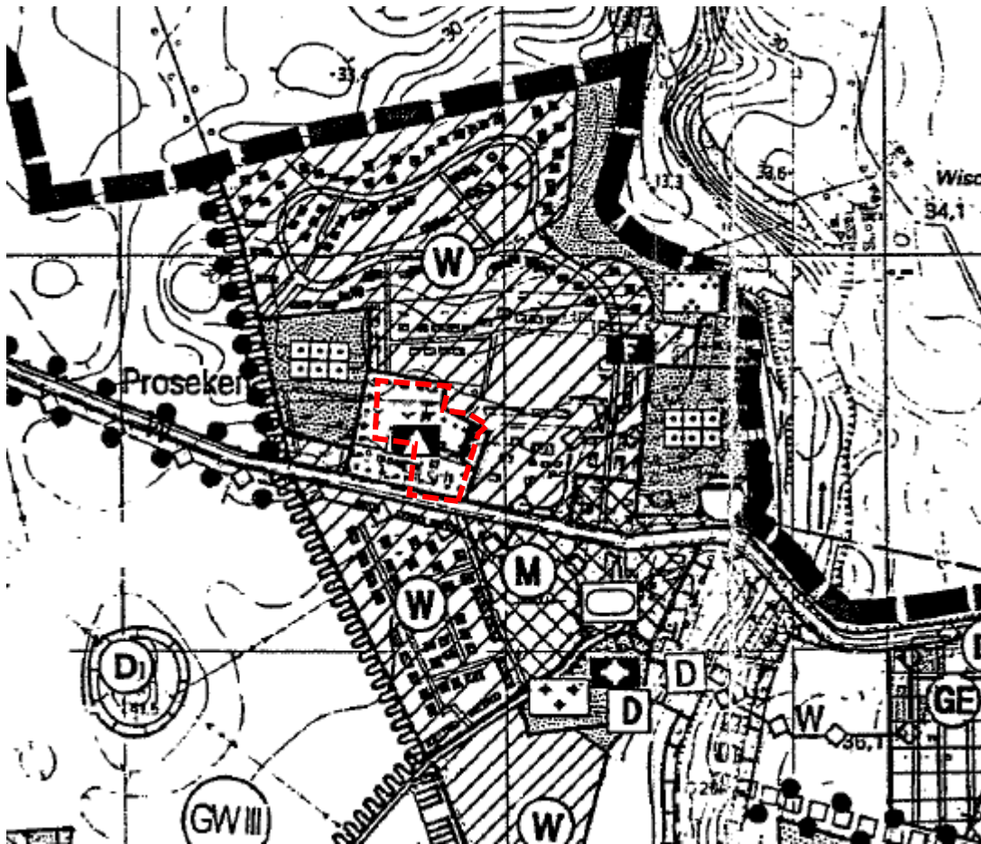
Ausschnitt aus dem wirksamen Flächennutzungsplan der Gemeinde Gägelow

Planungsrechtliche Grundlagen für die Erarbeitung der Satzung sind: